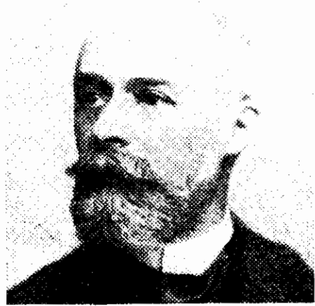
Antonio Enrique Becquerel

Hasta 1896 sus investigaciones estuvieron principalmente dirigidas al campo de los fenómenos ópticos y magnéticos y la fosforescencia. Más adelante, atraído por los trabajos de Roentgen, se dedicó a los estudios que lo conducirían al descubrimiento de la radiactividad del uranio o "rayos de Becquerel" como se los denominó entonces.