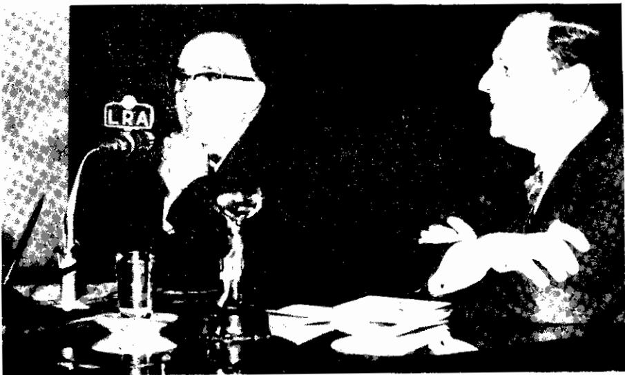
El ilustre huésped agradece los conceptos del contraalmirante Quintill...

"Y así como un argentino se considera entre los suyos cuando tiene el privilegio de visitar la Madre Patria, no necesito deciros, al ofrecer os nuestra más cálida hospitalidad, que os sintáis aquí, en la nuestra, como en vuestra propia patria?"