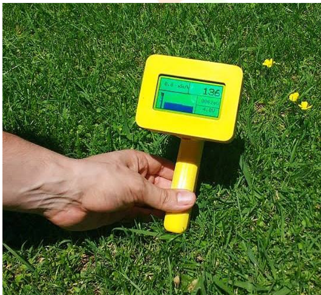
Radiómetro en plena medición.

Desde el descubrimiento de las radiaciones ionizantes , y en particular de la radiación gamma , con muchas aplicaciones útiles en la industria, ha sido de gran interés su medición precisa y en diferentes condiciones. El instrumento desarrollado para cumplir dicha función se llama radiómetro 3 y el más conocido mundialmente es el denominado Contador Geiger-Müller . A diferencia de este equipo, el recientemente desarrollado por la CNEA utiliza un detector conocido como centellador, haciéndolo todavía más sensible que el Geiger. El aparato contiene también un dispositivo fotomultiplicador y un sistema electrónico que hace funcionar el conjunto y visualizar / escuchar los resultados. Como está pensado para uso geológico, para mediciones de mineral de uranio en campo, fue menester su portabilidad. Por ello el equipo es de reducido tamaño y peso, cuenta con batería recargable incorporada, pantalla de cristal líquido y parlante, y está principalmente diseñado para medir la actividad radiactiva presente en el ambiente natural.