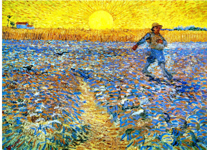
Vincent Van Gogh - Sembrador a la puesta del Sol (1888) - Museo Kroller-Müller (Otterlo - Países Bajos).

millones de años en el centro de una estrella, que demora millones de años en producir cambios y que es el responsable de que estemos escribiendo estas líneas, constituye un tema fascinante, y hay muchísimo más para leer y para investigar.