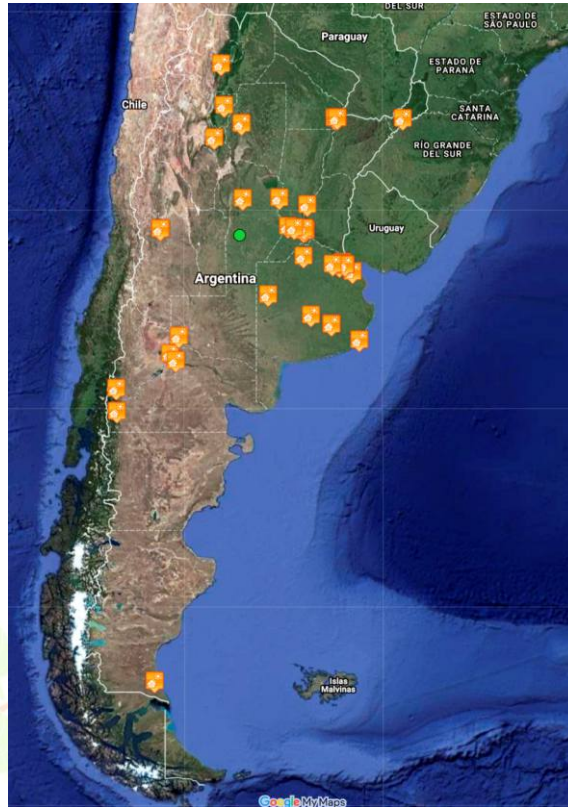
Fig. 2: Algunas instalaciones del proyecto IRESUD según Google Maps.

La generación distribuida mediante sistemas fotovoltaicos conectados a la red contribuye a reducir las pérdidas por transporte y distribución de la energía eléctrica generada en las grandes centrales de potencia, ya que dichos sistemas la generan cerca del lugar de consumo. Asimismo, al reemplazar parcialmente la energía de origen fósil, aportan a la disminución de las emisiones de gases de efecto invernadero. Por otra parte, los usuarios del servicio eléctrico que se convierten también en generadores toman mayor conciencia de la escasez de los recursos naturales y de la necesidad de hacer un