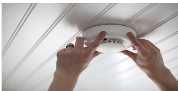
Fig.2 Detector de humo para ambientes.

Fábricas de refrescos ven necesario su uso para controlar automáticamente los niveles de envasado en objetos opacos a la vista, como ser las latitas de aluminio. En fábricas de papel y de cartón, una fuente radiactiva emisora de radiación beta puede controlar espesores en forma automática (Fig.1). La radiación ionizante aplicada a algunos monómeros y polímeros puede llegar a mejorar sus propiedades, generándose plásticos especiales con gran propiedad como aislante eléctrico y térmico. Radioisótopos, como trazadores 4 , permiten controlar sistemas de ventilación, fugas en cañerías o corrosión en materiales.