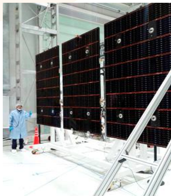
Paneles solares del SAOCOM 1A que proporcionarán la energía eléctrica necesaria para su funcionamiento.

res fotovoltaicos. A partir de este hito, la CONAE firma un convenio de cooperación con la CNEA para que el DES desarrolle los paneles solares y sensores de las siguientes misiones espaciales programadas. Este convenio dio origen a los desarrollos, por parte del DES, de las herramientas de diseño que incluyen modelos de simulación numérica (programa de computación que predice el comportamiento que tendrán los paneles en el espacio) y de los procesos de integración eléctrica, verificación y ensayo de los sensores de posición y paneles solares. Los sustratos 3 y mecanismos que dan sustento a las celdas solares y a otros componentes de los paneles fueron desarrollados por INVAP.