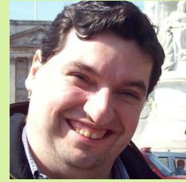
autor: Martín Abel González

Son dos términos distintos en idioma inglés pero en la mayoría de los otros idiomas se utiliza un vocablo común como traducción de ambos. En castellano ese término es seguridad, al que se lo ha calificado erróneamente con los adjetivos “tecnológica” y “física” para denotar la diferencia entre ambos términos, respectivamente. No es de extrañar, por lo tanto, que se cuestione qué