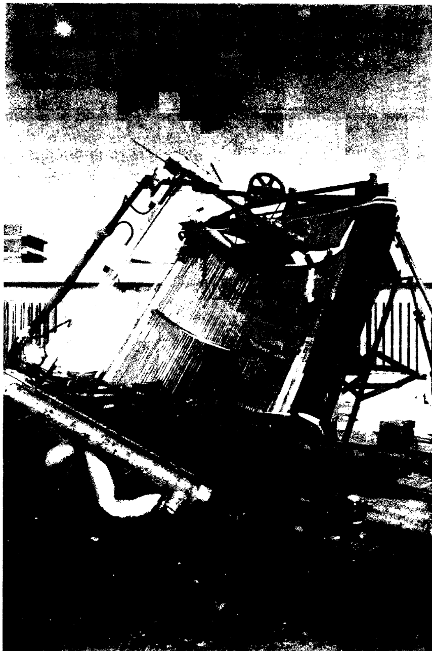
Fig. 3. — Prototipo de laboratorio de concentrador solar fijo de espejo facetado en ensayo en la Comisión Nacional de Energía Atómica. El reflector está formado por segmentos espejados largos y angostos ubicados sobre un semicilindro fijo. La posición de cada segmento está calculada para que el foco del concentrador recorra una semicircunferencia al desplazarse el Sol y, de este modo, pueda recolectarse continuamente el calor en un tubo que se mueve según esa circunferencia y por el cual circula un líquido. El prototipo tiene un área de intercepción de 4,6 \text{ m}^2 y produce una potencia pico de 2,3 \text{ kW} térmicos.

y en la Universidad de Buenos Aires. Se está comenzando también a trabajar en el desarrollo de otras energías no convencionales, entre ellas la eólica, la solar y la bioenergía, acción en la que colaboran varias instituciones con la coordinación de la Secretaría de Ciencia y Tecnología. En particular, la CNEA participa en los campos solar y eólico, considerando que es importante para ella, dado el carácter complementario que la energía nuclear y la solar presentan en el largo