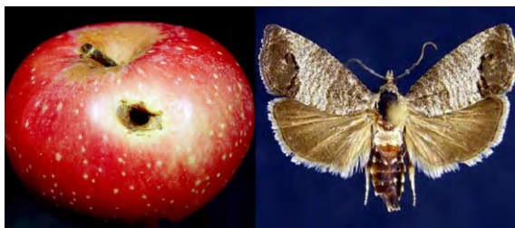
Manzana infestada por Cydia pomonella

Los agentes biológicos generadores de perjuicios se reconocen como: malezas, patógenos y plagas. El último grupo se conforma por vertebrados e invertebrados y dentro de estos se encuentran los artrópodos. Estos “animales articulados” (de arthros , articulación y podas , patas) están presentes en todos los biomas y tienen una gran importancia socio-económica. 2 Según los intereses del hombre, a estas especies se las identifica como benefactoras o perjudiciales. En la primera categoría se encuentran las abejas, algunas arañas y larvas, etc. y entre los dañinos encontramos a algunos insectos. Durante el almacenamiento de granos, estos invertebrados atacan los silos y se multiplican en forma inaudita. Las otrora barreras naturales (montañas, océanos, desiertos), dejaron de ser eficaces con los transportes aéreos y con el intenso tráfico y tránsito de personas entre regiones y continentes. Estas apreciaciones pueden verse exageradas, pero ¿quién de nosotros no ha visto ropa abordada por polillas, cucarachas en residuos, granos atacados por gorgojos, madera socavada por barrenadores o soportado molestias por presencia de moscas domésticas y mosquitos?