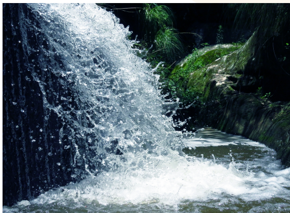
Recurso muy escaso.

Uno de los principales usos del agua en la generación de energía es en las centrales hidroeléctricas. Existen dos tipos de centrales hidroeléctricas, las de embalse y las de paso. En el caso de las primeras, la energía potencial del agua almacenada se convierte en electricidad a través de una serie de transformaciones. El pasaje de agua a gran presión, producida por la diferencia de altura entre el nivel de agua del embalse y la planta hidroeléctrica, genera suficiente fuerza para hacer rotar una turbina, la que a la vez mueve un generador de electricidad. En las de paso, la turbina es movida por la corriente natural del cauce. En Argentina las centrales hidroeléctricas constituyen el 24,3% del total