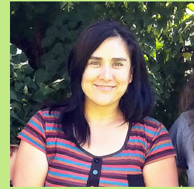
Autor Valeria Martín

de la potencia instalada 1 . Por otro lado, el agua es un elemento importante en los procesos de enfriamiento de las centrales termoeléctricas. En estos casos, el combustible se quema generando calor para calentar agua y transformarla en vapor. El vapor, a una presión muy elevada, hace girar una turbina. En el proceso, la energía calorífica se convierte en energía mecánica y posteriormente esta se transforma en energía