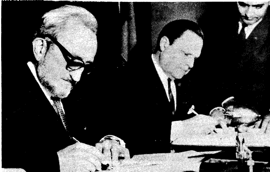
Instante de la firma del Convenio.