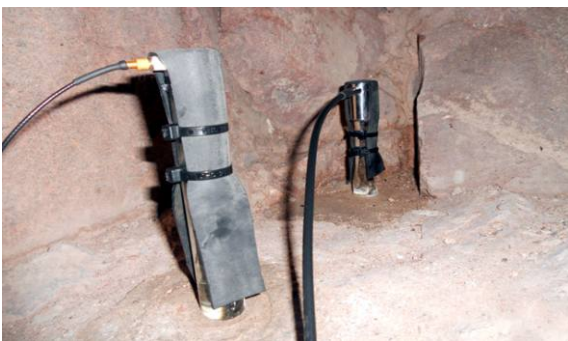
Fig. 3 Dos sensores de EA colocados en barras de vidrio empotradas en la roca de un cerro en Cacheuta, provincia de Mendoza, Argentina.

ción, nuclear, de producción de energía, para analizar tanques, puentes y estructuras, tuberías, vías de ferrocarril, represas, etc. Permite diagnosticar el estado de la estructura que se quiere estudiar, por ejemplo un gran tanque de acero que contenga petróleo, agua o gas o una viga de concreto. Para ello se tensiona la viga con el objeto de variar el campo de fuerzas al cual está sometido y se lo “escucha” con los sensores de EA (Fig. 2). En el caso de un puente, se varía la tensión soportada haciendo que lo transite una determinada cantidad de autos o camiones. Con la adecuada cantidad y disposición de sensores sobre una gran estructura, la EA permite, por el método de triangulación , ubicar las zonas potencialmente peligrosas, siendo este procedimiento el mismo que se aplica en el caso de los sismógrafos dispersos sobre la superficie de la Tierra para ubicar el epicentro de un terremoto. También posibilita verificar si una estructura de madera está o no infestada de termitas, simplemente escuchando el ruido que producen al alimentarse fracturando el material. En medicina, con EA se puede estudiar el funciona-