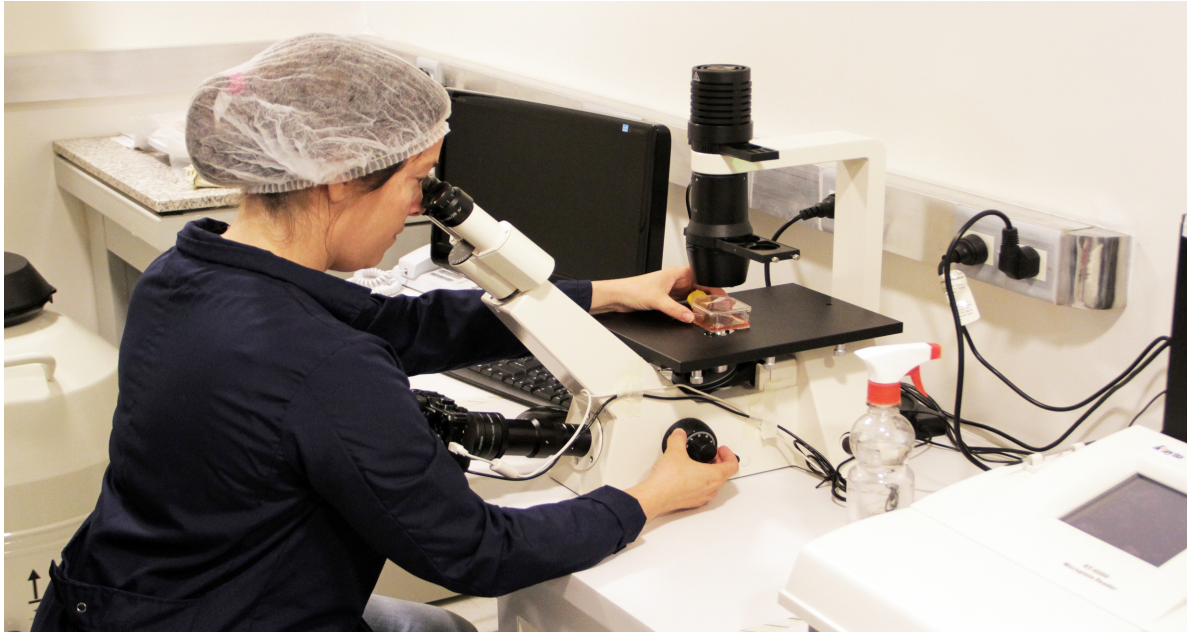
En el Laboratorio de Biotecnología del Centro Atómico Ezeiza (CNEA).

máquina presiona el material fundido a través de una sección determinada, creando hilos de sección fija, como muestra la primera imagen, que serán luego la materia prima de una impresora 3D.