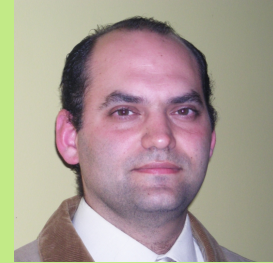
Autor Manuel Szejnberg

Ingeniero en Física Médica (Univ. Favaloro)