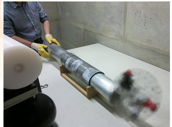
Fig. 1 - Generador de neutrones basado en fusión nuclear por confinamiento inercial electrostático de NSD-Gradél-Fusion.

décadas, en diferentes aplicaciones industriales 3 . Existen dispositivos de pequeña escala (entre los 10 cm y el metro, aproximadamente), que utilizan con tal fin abordajes basados en fusión DT y se los conoce como generadores de neutrones . Además, se desarrollan aceleradores de partículas con tamaños de algunos cuantos metros, que pueden producir neutrones aún con mayor intensidad.