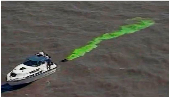
Inyección de uranina en las aguas costeras próximas a la bahía.