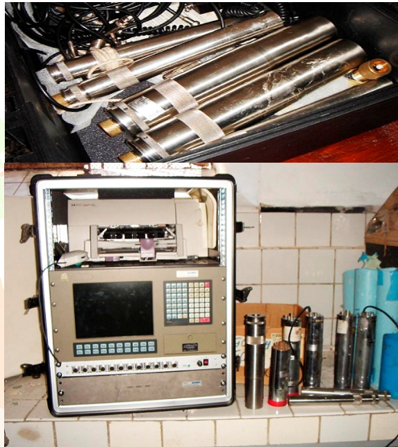
Equipo detector de radiación gamma.

Por su gran utilidad, desde hace años, se utilizan distintas sustancias trazadoras, también en biología, medicina, industria y ciencias de la Tierra.