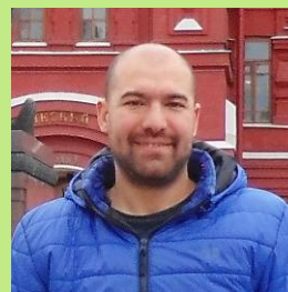
Autor: Franco E. Benedetto

Cuando se quiere usar el plasma en alguna aplicación industrial, es necesario construir un artefacto que nos permita generarlo y controlarlo. En el caso de una hornalla de cocina hogareña donde se mezclan metano y aire para producir una llama, su tamaño se regula con una perilla. Similarmente, en una antorcha (o torcha) de plasma se hace pasar algún gas (aire, nitrógeno, vapor de agua, etc.) a través de un arco eléctrico 1 para producir el plasma. La temperatura del plasma dentro de la torcha puede alcanzar los 6.000 °C o más. Regulando la energía eléctrica aplicada a la antorcha se regula la potencia del plasma. Estas torchas de plasma tienen múltiples aplicaciones industriales y existen en un amplio