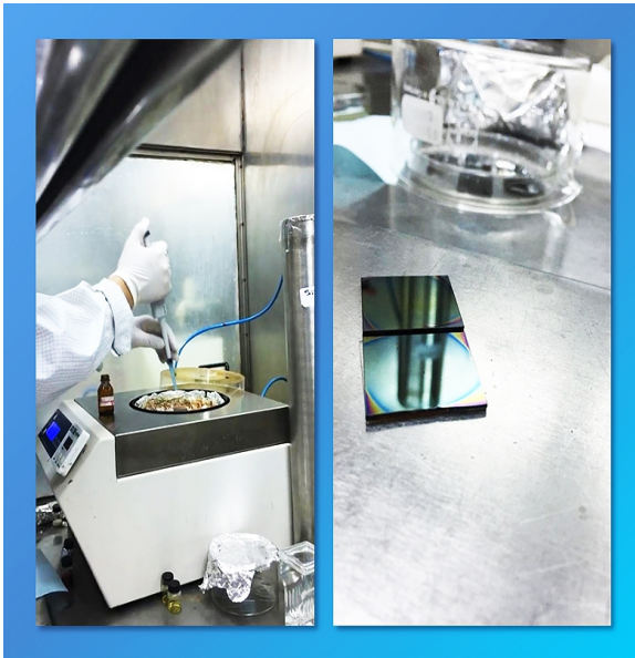
Fig. 2 Fabricación de las celdas de perovskitas en los laboratorios del DES (CNEA) IZQUIERDA: Depósito de películas de perovskitas a partir de solución líquida. DERECHA: Películas de perovskita previo a la incorporación del contacto metálico de oro.