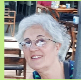
Autor Alicia Beascochea

El diseño solar pasivo respetando el clima del lugar y concebido desde el inicio del proyecto, es lo que permitirá obtener eficiencia energética en los edificios y por lo tanto disminuir las emisiones de gases de efecto invernadero, haciendo más eficaces las tecnologías alternativas en caso de que se cuente con recursos para incorporarlas, así se trate de edificios nuevos o de rehabilitaciones. Este diseño dependerá de la función a cumplir por el edificio y del sitio disponible. Para este caso, un amplio terreno permitió la orientación hacia el Norte de los dos edificios de dos pisos, previendo una futura ampliación a otro, también sin interferencias solares. Dada la experiencia en General Pico, con dos departamentos por nivel, y a los efectos de reducir los costos en muros exteriores y aumentar la compacidad 1 , se optó por agrupar tres unidades por nivel, poniendo especial cuidado en la ventilación natural del departamento central. Por tratarse de viviendas, se utilizó la orientación Norte para lograr ganancia solar directa 2 en invierno, en