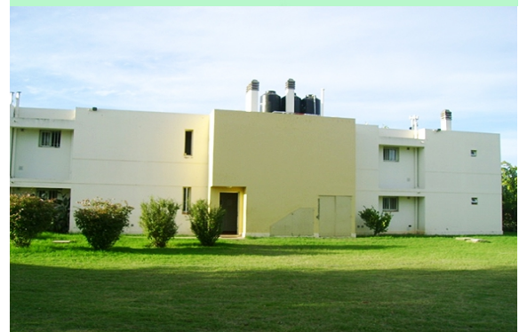
Vista Norte, planta y vista al Sur de uno de los dos edificios bioclimáticos destinados a residencia estudiantil de la UNLPam (Santa Rosa - Provincia de La Pampa).

todos los locales excepto sanitarios, masa térmica 3 , iluminación y ventilación natural, y protección de las áreas vidriadas con aleros que permiten controlar la ganancia solar en verano. En las ventanas con doble vidriado