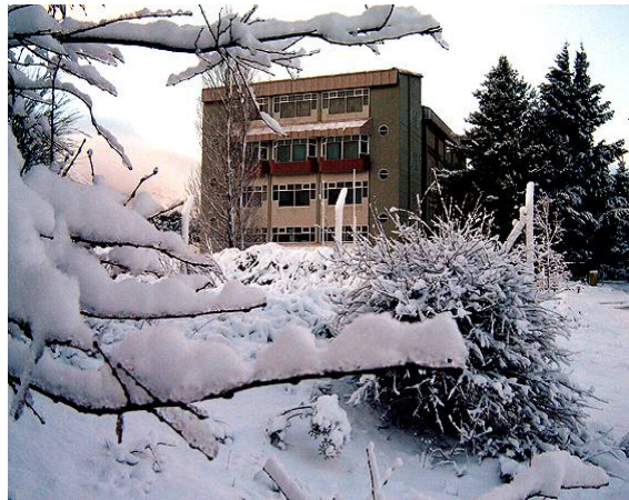
Reactor RA-6 del Centro Atómico Bariloche (CNEA)

La comprensión final de las causas del efecto estudiado, y la evidencia de que éste se produce también en la atmósfera —un medio en el cual la luz también viaja más lentamente que en el vacío— dio la idea a