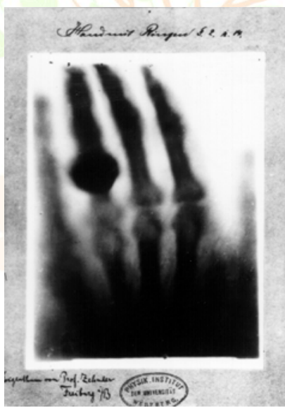
Fig. 1 Primera Radiografía tomada por Röntgen [1]

Posteriormente a que Wilhem Röntgen descubriera los rayos X en 1895, comenzaron a estudiarse varias de sus propiedades, entre ellas, su poder de penetración en los cuerpos opacos. Se supo que determinados objetos eran más o menos transparentes a esta radiación. La penetración de rayos de una determinada energía depende de la densidad y el espesor del material que deben atravesar. Los rayos que pasan a través de un cuerpo e inciden luego en una pantalla o placa de material sensible, reproducirán la imagen del mismo.