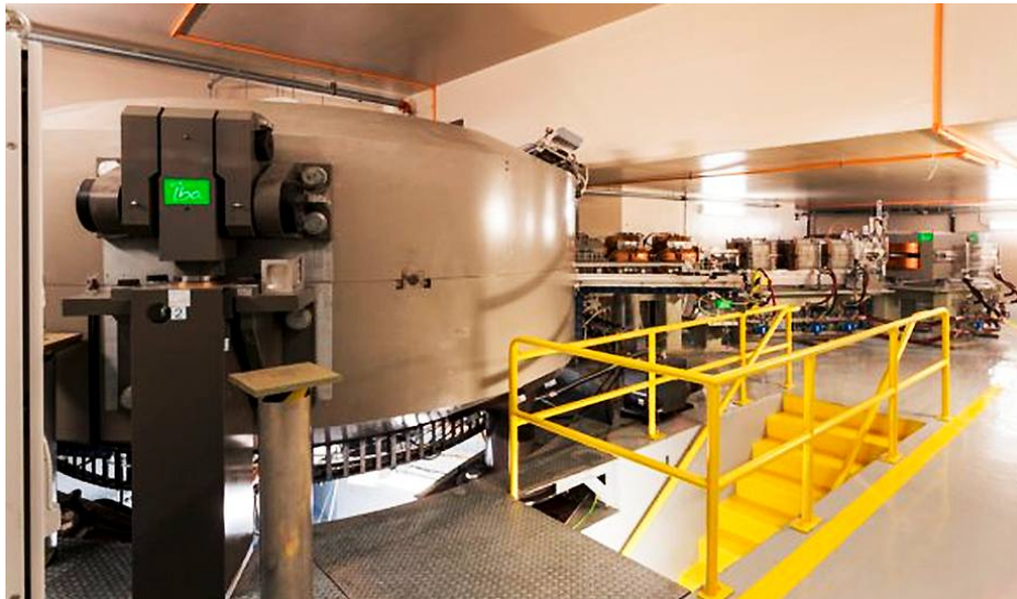
Ciclotrón de altas energías para la aceleración de protones

de 6.000 pacientes para Brasil. Considerando a toda Sudamérica, el total de pacientes candidatos por año es de más de 12.000. Este número equivale a 40 salas de protonterapia. La instalación del CEARP permitirá disponer, por primera vez en la región, de tecnología de última generación en protonterapia, ofreciendo servicios de salud para toda